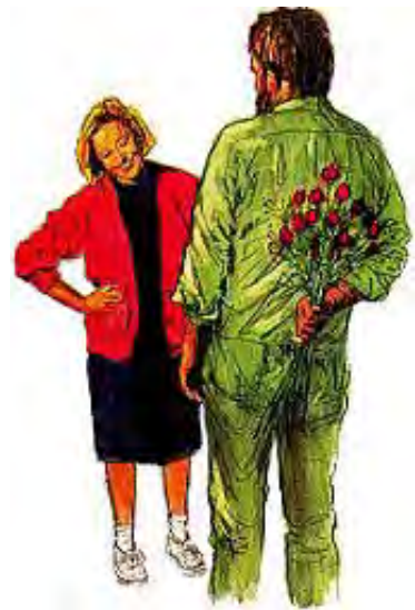
I znenadite jedan drugoga sa malim darovima.

Odgovor: Da li je ljubav skoro iščezla iz vašeg doma? Đavo, taj poznati razvaljivač doma, je za to odgovoran. Ne zaboravite da vas je Bog spojio u brak i Njegova namera je da zajedno ostanete i da budete srećni. On će vaše živote da ispuni srećom i ljubavlju ako živite po Njegovim pravilima, to jest, zapovestima. „Bogu je sve moguće.“ Matej 19:26. Ne očajavajte. Bog koji je u srce misionara usadio ljubav prema gubavom divljaku, je sposoban da i vama udeli ljubav jedan prema drugome, samo ako Mu to dozvolite.