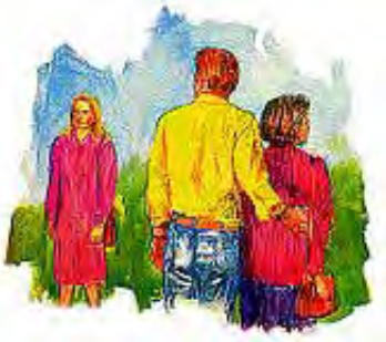
Pogrešni način mišljenja može da uništi vaš brak.

„Jer kako on tebe cijeni u duši svojoj tako ti jelo njegovo.“ (Engleski prevod: „Jer kako on misli u srcu svom, takav je.“) Priče 23:7. „Ne poželi žene bližnjega svojega.“ 2. Mojsijeva 20:17. „Svrh svega što se čuva čuvaj srce svoje, jer iz njega izlazi život.“ Priče 4:23. „Što je god istinito, ...pošteno, ... pravedno, ... prečisto, ... preljubazno, ... i još ako ima koja dobrodetelj, ... to mislite.“ Filipljanima 4:8.