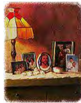
Sa Hristom u vašim srcima i domu, brak će biti uspešan.

Odgovor: To je najvažnije pravilo. Ono obuhvata sva ostala pravila. Hristu dajte prvo mesto! Stvarna tajna istinske sreće u domu nije diplomatija, strategija, niti neumorni napor u rešavanju problema, već veza sa Hristom. Srca koja su ispunjena Hristovom ljubavlju nikada ne mogu biti daleko jedno od drugog. Sa Hristom u domu, brak će biti uspešan. Evanđelje je lek za sve brakove koji su ispunjeni mržnjom, ogorčenošću i razočarenjem. Evanđelje sprečava hiljade razvoda tako što čudnovato obnavlja ljubav i sreću. Ako ste voljni, ono će sačuvati i vaš brak.