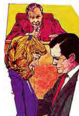
Oprostaj je uvek bolji nego razvod.

Odgovor: Biblija je jasna po tom pitanju. Bračna veza je uspostavljena da bude neraskidiva i neuništiva. Samo u slučaju preljube se razvod dozvoljava, ali ne i zahteva. Oprostaj je uvek bolji od razvoda, čak i u slučaju moralnog pada. Brak treba da traje celog života. Tako je Bog to odredio kada je u Edemskom vrtu obavio prvu svadbu. Pomisao na razvod kao rešenje će da uništi svaki brak. Zbog toga Isus nije razvod uzeo u obzir. Razvod je uvek štetan i skoro nikad nije rešenje za probleme. On stvara veće probleme, pa stoga nikad ne treba ni misliti o njemu. Posle razvoda život skoro uvek biva rastrgnut, nesrećan, zapleten i neuspešan. Bog je uspostavio brak da sačuva ljudsku čistoću i sreću, da zadovolji ljuske društvene potrebe, i da uzdigne ljudsku fizičku, umnu i moralnu prirodu. Bračni zaveti se ubrajaju u najsvečanije i najbližnje obaveze koje ljudska bića mogu na sebe da preuzmu. Omalovažavanje i neispunjavanje istih vodi ka gubljenju Božije naklonosti i blagoslova.