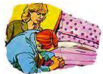
Glasno se molite jedan za drugoga.

Odgovor: Veoma je opasno da ostanete ljuti i uznemireni zbog (velikih ili malih) uvreda i nepravda. Ako se brzo ne razreše, čak i mali problemi ostavljaju utisak na vaš um, formirajući ubeđenja i stavove koji mogu negativno da utiču na celu vašu životnu filozofiju. Zato Bog kaže da, pre nego što odete na počinak, vaša ljutnja treba da se ohladi. Budite dovoljno plemeniti da oprostite i iskreno kažete: „Žao mi je.“ Na kraju, niko nije savršen, i vi oboje pripadate istom timu; stoga budite kao sportisti i pošteno priznajte pogrešku kada je načinite. Osim toga, pomirenje je vrlo prijatno iskustvo, sa neobičnim silama da zbliži bračni par. Bog predlaže da tako činite! To donosi dobre rezultate!