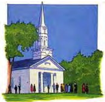
Gospodnji dan je Subota, a ne Nedelja.

Da „prozoveš subotu milinom, ... dan Gospodnji slavlijem.“ Isaija 58:13. „Jer je gospodar od subote sin čovječij.“ Matej 12:8