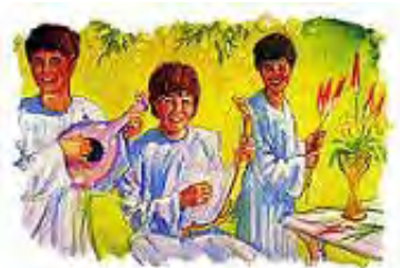
U večnom Božijem carstvu će svi da drže Subotu svetom.

Odgovor: Jeste, Biblija kaže da će na novoj zemlji spašeni ljudi svih vekova da svetkuju Subotu.