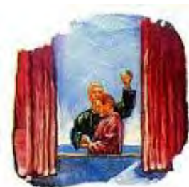
U čast Svoga vaskrsenja je Isus uspostavio krštenje, a ne svetkovanje Nedelje.

„Ili ne znate da svi koji se krstismo u Isusa Hrista, u smrt njegovu krstismo se? Tako se s njim pogrebosmo krštenjem u smrt da kao što usta Hristos iz mrtvih slavom očinom, tako i mi u novom životu da hodimo. Jer kad smo jednaki s njim jednakom smrću, bićemo i vaskrsenjem; znajući ovo da se stari naš čovjek razape s njime, da bi se tijelo grješno pokvarilo, da više ne bismo služili grijehu.“ Rimljanima 6:3-6.