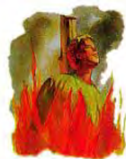
Milioni Hrišćana su umrli u toku Mračnog Srednjeg Veka. Mnogi su bili spaljeni na lomačama.

Ispunjenje: To proročanstvo uglavnom ukazuje na dug period nevolje za vreme Mračnog Srednjeg Veka, pod uticajem pale crkve. On je trajao više od 1.000 godina. U tom periodu velike nevolje je preko 50 miliona Hrišćana izgubilo svoje živote zbog vere. Jedan pisac je pisao da je pala crkva „prolila više nevine krvi nego ikoja institucija koja je ikada postojala među ljudima na zemlji.” W.E.H. Lecky, Istorija Uzdanja i Uticaja Duha Racionalizma u Evropi , (Novo izdanje; Njujork: Braziller, 1955) Komplet 2, st. 40-45.