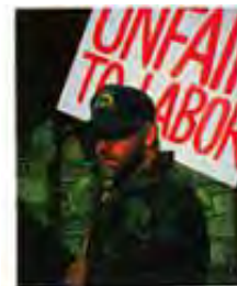
Borba između kapitala i rada je znak Isusovog drugog dolaska.

Predviđeno je da će u poslednje dane postojati problemi između kapitala i rada. Da bi se u to uverio, pogledaj samo u tvoje lokalne novine.