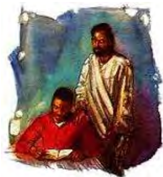
Nikada ne treba da budemo tako zauzeti, da nemamo vremena za Hrista.

Odgovor: Isus kaže: „Evo stojim na vratima i kucam: ako ko čuje glas moj i otvori vrata, ućiću k njemu i večeraću s njime, i on sa mnom." Otkrivenje 3:20. Posredstvom Svetoga Duha i moje savesti, Isus kuca i traži da uđe u moje srce da bi mogao da promeni moj život. Ako ja Njemu potpuno predam svoj život, On će izbrisati sve grehe moje prošlosti (Rimljanima 3:25) i daće mi silu da živim pobožnim životom (Jovan 1:12). I kao besplatan dar, On meni sada udeljuje Njegov pravedni karakter, da bi bez straha mogao da stanem pred Bogom. Kada Isus promeni moj život, izvršavanje Njegove volje postaje zadovoljstvo. To je tako jednostavno da mnogi čak i sumnjaju da je to moguće. Ali to je istina. Sa moje strane ja treba jednostavno da predam Hristu moj život i da Mu dozvolim da On u meni boravi. Njegov deo je da na čudnovat način promeni moj život i pripremi me za Njegov drugi dolazak. To je besplatni dar. Ja samo treba da ga prihvatim.