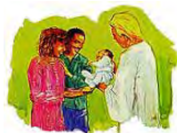
Male bebe koje je smrt otela iz naručja roditelja, biće im vraćene kad Isus ponovo dođe.

Odgovor: Pravednici, koji su umrli, će da vaskrsnu iz svojih grobova, sa telima savršanim i besmrtnim, kao što je to Hristovo telo, i kao takvi će se uzdići na oblake da sretnu svoga Gospoda. A onda će i živi pravednici da se preobrazu u besmrtna bića, i da se uzdignu u oblake, Gospodu u susret. Potom će Isus sve pravednike da povede u nebo. Obrati pažnju da Isus neće da se spusti na zemlju po Svom drugom dolasku. Sveti će sa Njim da se susretnu „u vazduhu”. Zbog toga će Božiji narod koji očekuje Spasitelja, da ignoriše svaku vest da je Hristos došao u Baltimor, Novi Orleans, Los Andjelos, ili bilo koje drugo mesto. Pre tog velikog