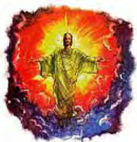
Isus je rekao da će se na oblacima On vratiti na ovu zemlju.

„I ovo rekavši vidješe oni gdje se podiže i odnese ga oblak iz očiju njihovijeh. I kad gledahu za njim gdje ide na nebo, gle, dva čovjeka stadoše pred njima u bijelijem haljinama, koji i rekoše: ljudi Galilejci! Šta stojite i gledate na nebo? Ovaj Isus koji se od vas uze na nebo tako će doći kao što vidjeste da ide na nebo.“ Djela Apostolska 1:9-11.