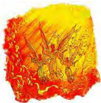
Svi nebeski anđeli će da prate Hrista po Njegovom drugom dolasku.

„A kad dođe sin čovječij u slavi svojoj i svi sveti anđeli s njime, onda će sjesti na prijestolu slave svoje.” Matej 25:31.