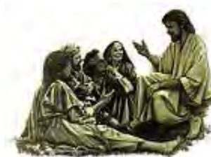
Isus je učio da će On doći na ovu zemlju po drugi put.

Odgovor: Jeste! Kod Mateje 26:64, Isus pod zakletvom svedoči da će On ponovo doći na ovu zemlju. S obzirom da je Sveto Pismo pouzdano (Jovan 10:35), Njegov drugi dolazak je siguran. To Hristos lično garantuje.