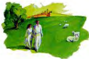
Isus će Svoj narod da odvede u nebo i tamo će mu povratiti sve što su Adam i Eva izgubili.

„I evo ću doći skoro, i plata moja sa mnom, da dam svakome po djelima njegovijem.” Otkrivenje 22:12. „Opet ću doći, i uzeću vas k sebi da i vi budete gdje sam ja.” Jovan 14:3. „I da pošalje ... Isusa Hrista, ... kojega valja dakle nebo da primi do onoga vremena kad se sve popravi.” Djela Apostolska 3:20, 21.