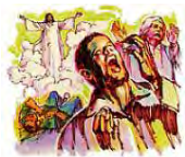
Po drugom Isusovom dolasku će grešnici biti pogubljeni.

„Duhom usana svojih ubiće bezbožnika.” Isaija 11:4. „I u onaj će dan biti od kraja do kraja zemlje pobijeni od Gospoda.” Jeremija 25:33.