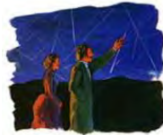
Veliko padanje zvezda (meteorska kiša) se dogodilo 13. Novembra, 1833. godine

*Peter A. Millman, „Padanje Zvezda”, Teleskop , 7 (Maj-Juni, 1940) 57.