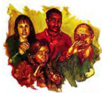
Kad Isus bude došao po drugi put, svi živi na ovoj zemlji će Ga videti.

Napomena: U Bibliji se nigde ne spominje tajno uznesenje u koje danas mnogi veruju. To je samo ljudska izmišljotina. Niti je drugi dolazak duhovni ulazak u srce prilikom obraćenja. Taj dolazak se ne odigrava kad čovek umre, niti je on simboličan, to jest, stupa na snagu kad se na svetu poprave uslovi života. Sve te teorije potiču od ljudi. Drugi dolazak će biti bukvalan, za celi svet, vidljiv, i sa ličnom pojavom Hrista na oblacima, da ovom svetu učini kraj, i da svim ljudima udeli nagradu ili kaznu.