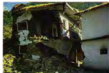
Današnji zemljotresi su mali u poređenju sa masivnim zemljotresom koji će se dogoditi kad Isus dođe.

Odgovor: Po dolasku Gospodnjem će zemlju da zadesi veliki zemljotres. Taj zemljotres će biti tako razoran, da će potpuno uništiti ceo svet.