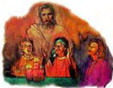
Prilikom seanse u sobi, onaj što izgleda da je Isus, je ustvari jedan od Sotoninih đavola koji oličuje Isusa.

bude moguće, i izbrane." Matej 24:24. „Zakon i svjedočanstvo tražite. Ako li ko ne govori tako, njemu nema zore [u njemu nema vidjela (engleski prevod)]." Isaija 8:20.