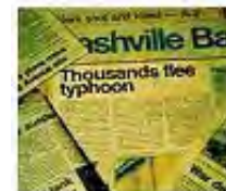
Stah od budućnosti je znak Isusovog povratka.

To čudno nalikuje na članke iz dnevnih novina--savršena slika današnjeg sveta--a za to ima i razloga: Mi smo ljudi poslednjih dana ovozemaljske istorije. Ne treba da nas iznenađuje napeta atmosfera koja vlada u današnjem svetu. Hristos je to preokao. To treba da nas ubedi da je Njegov dolazak blizu.