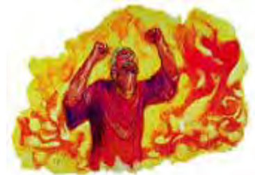
Grešnici će biti bačeni u pakleni oganj na kraju sveta -- a ne kad umru.

Odgovor: Ne kad umru, već na kraju sveta -- na dan velikog suda -- će grešnici biti bačeni u pakleni oganj. Bog neće da kazni nijednu osobu u ognju dok se na kraju sveta njen slučaj ne razmotri na sudu. Niti će on da kazni 5.000 puta više ubicu koji je umro pre 5.000 godina, nego ubicu koji danas umre, a zaslužuje istu kaznu.