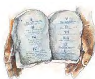
Biblija kaže da je Antihrist pokušao da promeni Božiji zakon.

U svom katehizmu je papstvo izbacilo drugu zapovest koja se odnosi na obožavanje idola, a četvrtu zapovest je skratilo na nekoliko reči. Zatim je podelilo desetu zapovest na dva dela. (Pogledaj u katehizam, i sam se u to uveri. Uporedi Deset Zapovesti katoličkog katehizma sa Deset Zapovesti zabeleženih u Bibliji u 2. Mojsijevoj 20:3-17.) Nema sumnje da se na papsku silu odnosi mali rog (Antihrist), prikazan kod Danila 7. Nijedna druga organizacija ne odgovara tim opisima. To nije novo učenje. Bez izuzetka su svi Reformatori prošlosti govorili o papstvu kao Antihristu. 8