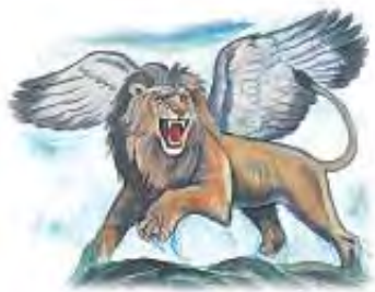
Zver u obliku lava iz Danila 7 pretstavlja Vavilonsku imperiju.

„Podignuće na tebe Gospod narod ... koji će doletjeti kao orao.” 5. Mojsijeva 28:49. „Ovako veli Gospod nad vojskama: ... Velik će se vior podignuti od krajeva zemaljskih. I u onaj će dan biti od kraja do kraja zemlje pobijeni od Gospoda.” Jeremija 25:32, 33.