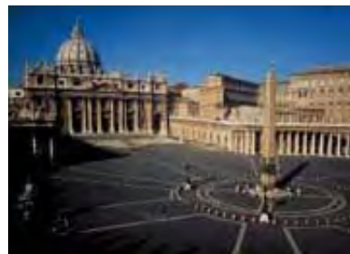
Papstvo jasno reflektuje svih devet tačaka identifikacije.