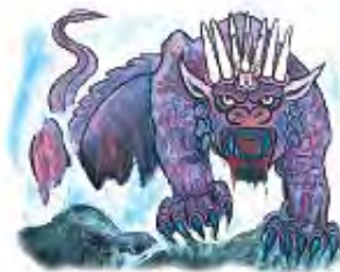
Rimaska imperija je u Danilu 7 simbolički pretstavljena kao čudovište.

Vizigoti--Španija Anglo-Saksonci--Engleska Franki--Francuska Alemani--Nemačka Burgundi--Švajcarska Lombardi--Italija Suevi--Portugalija