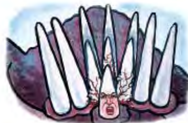
Mali rog u Danilu 7:8 pretstavlja Antihrista.

Odgovor: Zatim se pojavljuje sila koja je pretstavljena kao „mali rog“. Moramo tu silu brižljivo da identifikujemo, jer Bog koristi više reči da nju opiše nego sva četiri carstva zajedno. Zašto? Zato što tu silu u Bibliji spomenute karakteristike identifikuju kao Antihrista u proročanstvu i istoriji. Ne sme se počinuti greška u identifikovanju te sile.