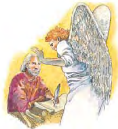
Anđeo je Danilu rekao da će proročanstva njegove knjige biti

Odgovor: U Danilu 12:4 stoji zapisano da je proroku bilo rečeno da zapečati delove njegove knjige do „poslednjih dana“. U 6. stihu se kaže da je jedan anđeoski glas zapitao: „Kada će biti kraj tijekom čudesima?“ A u 7. stihu sledi odgovor: „... Da će se ovo ispuniti po vremenu, po vremenima, i po po vremena“. Anđeo je osigurao Danilu da će delovi knjige, koji se odnose na proročanstva poslednjih dana, biti razjašnjeni po isteku perioda od 1.260 godina papske kontrole, što znači posle 1798. godine. Dakle, vreme kraja je počelo 1798. godine. Očigledno je da Danilova knjiga sadrži značajne poruke sa neba za nas danas. Mi apsolutno moramo da ih razumemo.