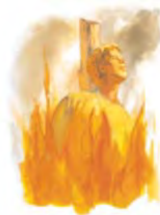
Biblija kaže da je Antihrist trebao da progoni Božiji narod.

Ne zaboravi da sve te tačke identifikacije dolaze direktno iz Biblije. To nije ljudsko mišljenje ili nagađanje. Istoričari bi mogli brzo da kažu na koju silu se odnose gornji opisi. Oni se odnose samo na jednu silu, a to je - papstvo. Da bismo se u to potpuno ubedili, to jest, da ne bi ostalo mesta za sumnju, razmotrićemo sada, jednu po jednu, svih tih devet karakteristika.