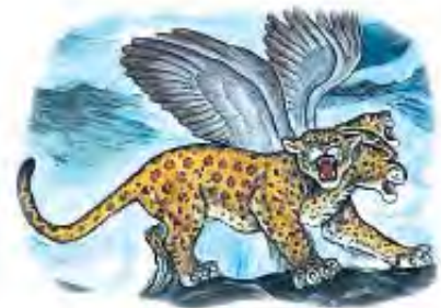
Leopard iz Danila 7 pretstavlja Grčko svetsko carstvo.

Odgovor: Četiri glave predstavljaju četiri carstva na koja se raspala imperija Aleksandra Velikog, posle njegove smrti. Četiri generala, koja su preuzela upravu nad tim oblastima, su bila: Kasander, Lisimak, Ptolomej i Seleuk. Četiri krila (u poređenju sa dva krila u lava) predstavljaju izuzetnu brzinu kojom je Aleksandar osvajao teritorije (Jeremija 4:11-13).