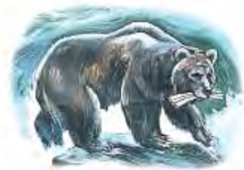
Medved sa tri rebra u ustima svojim pretstavlja Medo-Persiju.

Odgovor: Pročitaj 8. glavu u Danilovoj knjizi. Primeti da postoji paralela između zveri prikazanih u 7. i 8. glavi. Danilo 8:20 spominje Medo-Persiju (carstvo koje prethodi Grčkoj, koje je u stihu 21 pretstavljeno kao runjavi jarac). Medo-Persija je drugo svetsko carstvo, koje je u Danilu 7 pretstavljeno kao medved. Ta imperija se sastojala od dve grupe ljudi. Midi su došli prvi (što je u Danilu 7:5 prikazano kao medved koji ustaje na jednu stranu); Persijanci su bili drugi, ali su kasnije postali jači (prikazani kod Danila 8:3 kao drugi, viši rog). Tri rebra predstavljaju tri glavne sile pobeđene od strane Medo-Persijanaca, a to su: Lidija, Vavilon i Egipat.