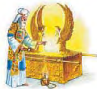
Sveštenikova služba pred sedištem milosti je predstavljala Isusovu službu u nebu za nas.

Gore navedeni simbolički stepeni pomirenja su bili vršeni po ugledu na službu u nebeskoj svetinji, a koja pretstavlja Božiji nebeski vrhovni štab svemira. Uporedi, korak po korak, gornje simboličke službe pomirenja sa dole prikazanim službama u nebeskoj svetinji. Primiti kako je Bog jasno u simbolu prikazao te velike događaje pomirenja: