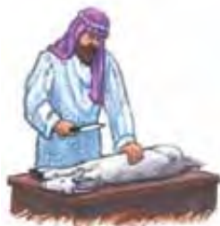
Žrtvovana životinja je predstavljala Isusovu žrtvu na krstu.