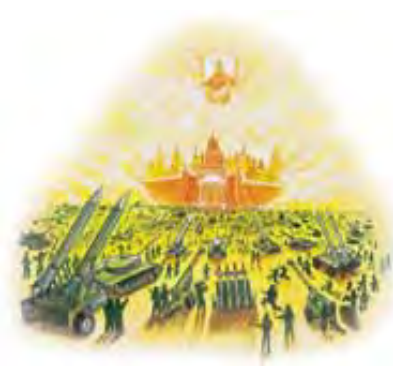
Treća faza suda će da poremeti plan za napad na grad.

Odgovor: Iznenada i bez najave, Bog se pojavljuje nad gradom u Svojoj skoro paralizujućoj svetlosti (Otkrivenje 19:11-21). Čas istine je došao. Svaka izgubljena duša od postanja sveta, uključujući tu i Sotonu sa svojim anđelima, se sada suočava sa Bogom na sudu. Svako oko je upereno u Cara nad carevima (Otkrivenje 20:12).