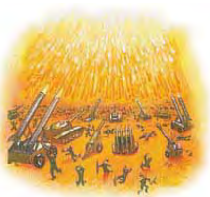
Oganj s neba će zauvek da uništi greh i grešnike.

koji ih varaše bi bačen u jezero ognjeno." Otkrivenje 20:9, 10. „Jer će oni [bezbožnici] biti pepeo pod vašim nogama." Malahija 4:3. „Jer, gle, ja ću stvoriti nova nebesa i novu zemlju." Isaija 65:17. „Ali čekamo po obećanju njegovu novo nebo i novu zemlju, gdje pravda živi." 2. Petrova 3:13. „Evo skinije Božije među ljudima ... i oni će biti narod Njegov, i sam Bog biće s njima Bog njihov." Otkrivenje 21:3.