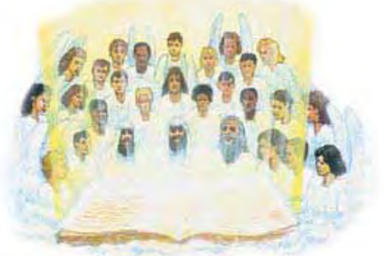
Božiji sveti svih vekova će da učestvuju u drugoj fazi suda.

Pretpostavimo da članovi neke porodice otkriju da u nebu nije njihov ljubljani sin koji je bio ubijen. Ali ubica jeste. Bez sumnje, oni bi se tome čudili. Druga faza suda će da pruži odgovore na sva pitanja pravednika. Oni će brižljivo da ispitaju živote svih izgubljenih osoba (uključujući tu i Sotonu i njegove anđele), i na kraju će potpuno da se saglase sa Isusovom odlukom u vezi sa svačijom nagradom. Svima će postati jasno da sud nije bio proizvoljan. On je jednostavno potvrdio odluke koje su ljudi sami doneli, da služe ili Isusu ili drugom gospodaru (Otkrivenje 22:11, 12). (Osvrni se na 12. Lekciju za detalje u vezi sa 1.000-godišnjim periodom.)