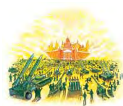
Grešnici će pokušati da napadnu sveti grad.

započne silnu propagandnu kampanju da ih zavede. Začuđujuće je to što će on uspeti da sve narode i nacije na zemlji ubedi da je moguće zauzeti sveti grad.