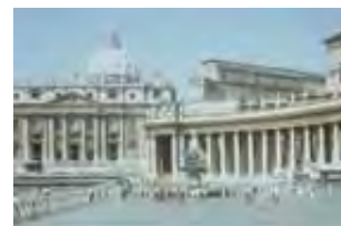
Više od 100 nacija ima

Odkako je isceljenje započelo, papska sila je porasla i ojačala, dok nije danas postala jedna od najmoćnijih religijsko-političkih organizacija i uticajnih centara u svetu. Malakaj Martin, odani Vatikanski poverenik i stručnjak za inteligenciju, otkriva sledeće u svojoj