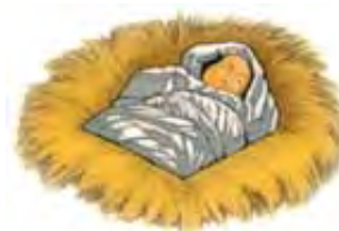
Car Irod je pokušao da „proždere“, ili ubije Isusa kad se On rodio.

Da bismo saznali ko je aždaha, pogledajmo 12. glavu Otkrivenja u kojoj je Božija crkva poslednjeg vremena predstavljena kao čista žena. U proročanstvu, čista žena predstavlja pravi Božiji narod ili crkvu (Jeremija 6:2; Isaija 51:16). (U 23. Lekciji će detaljno biti prikazana Božija crkva poslednjeg vremena, spomenuta u Otkrivenju 12. glavi. 22. Lekcija će da objasni 17. i 18. glavu Otkrivenja, u kojima su pale crkve simbolički predstavljene kao pala majka sa svojim palim ćerkama.) Čista žena je bila trudna i spremna da se porodi. Aždaha se blizu šunjala, u nadi da „proždere“ njenu bebu kad se rodi. Međutim, kada se rodila muška beba, Ona je izbegla aždahu, ispunila Svoju misiju i uznela se na nebo. Očigledno je da se to odnosi na Isusa, koga je Irod pokušao da uništi kada je naredio da se pogube sve bebe u Vitlejemu (Matej 2:16). Prema tome, aždaha predstavlja paganski Rim, u kojem je Irod bio car. Sila u pozadini Irodovog plana je, naravno, bio đavo (Otkrivenje 12:7-9). Sotona deluje kroz različite vlasti da izvrši svoj odvratni posao--u ovom slučaju, kroz paganski Rim.