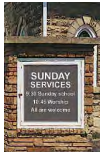
Nedelja kao sveti dan je zverin žig ili simbol autoriteta.