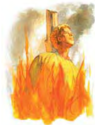
Millioni Hrišćana su izgubili živote za vreme progonstva od strane papstva.

Očigledno je da je rana isceljena i da su oči svih nacija uperene u Vatikan. Prema tome, i ova tačka odgovara papstvu.