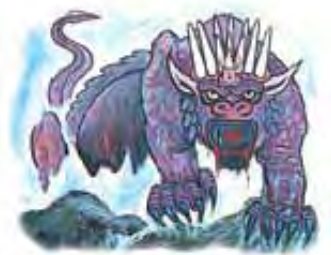
Zver iz Otkrivenja 13. glave simbolizira Antihrista.

More (ili voda) u proročanstvu pretstavlja ljude, ili gusto naseljene teritorije (Otkrivenje 17:15). Prema tome, zver, ili Antihrist, je trebao da proizađe iz postojećih nacija tada poznatog sveta. Kao što smo već saznali, papstvo je proizašlo iz zapadne Evrope, pa prema tome odgovara ovoj tački opisa.