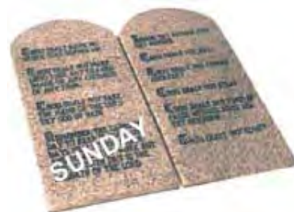
Promena Subote u Nedelju zahteva promenu Božijeg zakona, a to je vrlo ozbiljna stvar.

Ono odgovara: „Da, jesmo. To je naš simbol ili žig autoriteta i sile.”