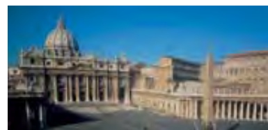
Papstvo je Antihrist.

Četiri zveri iz Danila 7 su prikazane kao delovi zveri koja se odnosi na Antihrista, a to je zbog toga što je papstvo preuzelo verovanja i običaje iz svih četiri pređašnjih imperija. Ta verovanja i običaje je papstvo ogrnulo duhovnim plaštem i u svet poslalo kao hrišćansku nauku. Evo jednog od mnogih istorijskih dokaza u prilog toga: „U izvesnom smislu je ono [papstvo] sebe organizovalo po ugledu na Rimsku imperiju, sačuvalo je i unapredilo filozofske institucije Sokrata, Platona i Aristotela, pozajmilo je neke stvari od Varvara i Vizantijske Rimske imperije, ali ono uvek ostaje posebno, dok potpuno preživa te elemente uzete iz spoljašnjih izvora.“ 1 Ova tačka definitivno odgovara papstvu.