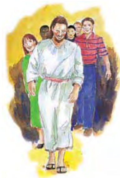
Sleđenje Isusa mora da uključi držanje Subote kao Njegovog svetog sedmog dana.

Možda se pitaš šta protestantske crkve kažu o papskoj tvrdnji u vezi sa promenom svetkovanja Subote u Nedelju. Navodi sledećeg odeljka, pod naslovom „Pitanja za Razmišljanje”, će da ti pruže potresne odgovore.