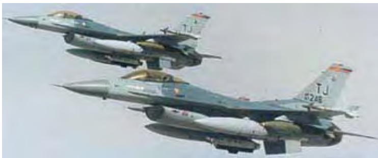
Sve nacije sveta se sada obraćaju Sjedinjenim Američkim Državama za zaštitu i pomoć.