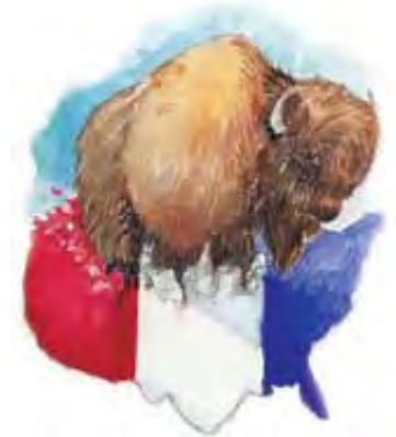
Zver iz Otkrivenja 13:11-18 simbolički pretstavlja Ameriku.

Odgovor: U 10. stihu spomenuto zarobljavanje pape se odigralo 1798. godine. U to vreme je (prema 11. stihu) nova sila trebala da se pojavi na scenu. Sjedinjene Američke Države su 1776. objavile svoju nezavisnost, 1787. izglasale Ustav, 1791. usvojile Akt o Pravima, a 1798. su već bile priznate kao svetska sila. Vreme očigledno odgovara Americi. Nijedna druga svetska sila bolje ne zadovoljava te biblijske opise.