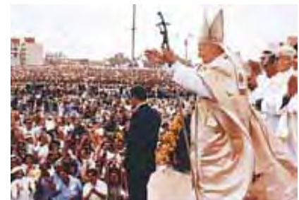
Papa je izuzetno popularni svetski vođa.