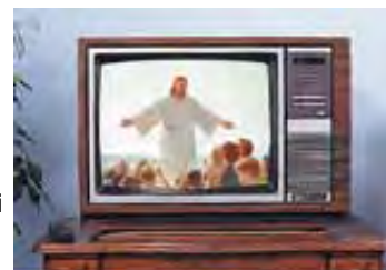
A najveće čudo od svega će biti kad se Sotona prikaže kao Isus.

Milijarde ljudi će biti prevarene. Verujući da je Sotona Isus, milijarde ljudi će da mu se poklone i pridruže lažnom