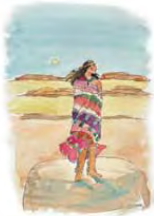
Proročanstvo je predvidelo nastajanje Amerike na retko naseljenoj teritoriji.

Odgovor: Ova nacija je izašla „iz zemlje“, a ne iz vode, kao što je to bio slučaj sa drugim nacijama spomenutim u Danilu i Otkrivenju. Prema Otkrivenju znamo da vode simboliziraju gusto naseljene svetske oblasti. „Vode što si vidio, gdje sjedi kurva, ono su ljudi i narodi, i plemena i jezici.“ Otkrivenje 17:15. Prema tome, zemlja pretstavlja nešto sasvim suprotno. Proročanstvo kaže da je ta nova nacija trebala da proizađe iz oblasti koja je bila skoro nenastanjena pre završetka 18. veka. Dakle, ona nije mogla da proizađe iz pretrpanih i borbom rastrgnutih nacija staroga sveta, već je trebala da se pojavi na retko naseljenom kontinentu.