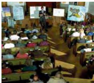
U poslednjim danima na zemlji će Božija vest nade da dospe do svake osobe.