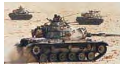
Amerika je najveća svetska vojna sila.

Kada je marksistička grupa svrgnula vlast u Etiopiji, od Amerike se tražilo da posreduje. Kada je Boris Jelšin postao predsednik nove nezavisne Rusije, on je prvo posetio Ameriku. Bivši predsednik Sovjetskog Saveza, Mikhail Gorbačev, se u svojoj krizi obratio Americi. Kada je Kuvajt bio napadnut, njegova vlast je pozvala Ameriku u pomoć. Američki rat u Iraku je skoro ceo svet podržavao. Korespondent Javnog Nacionalnog Radija je američkog predsednika nazivao „predsednikom sveta“. Mi sada imamo „vrlo neobičnu svetsku strukturu, sa Sjedinjenim Američkim Državama kao jedinom silom na vrhu internacionalnog sistema.“ Krauthammer, Nova Republika , s. 23.