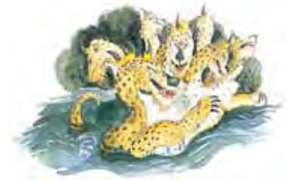
Zver prikazana u Otkrivenju 13:1-10 simbolički pretstavlja papstvo.

Odgovor: Zver sa sedam glava (Otkrivenje 13:1-10) se ne odnosi ni na kog drugog, osim na Rimsko papstvo. (Pogledaj 15. Lekciju koja detaljno razrađuje tu temu.) Seti se da zveri u biblijskom proročanstvu simboliziraju nacije ili svetske sile (Danilo 7:17, 23).