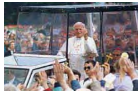
Papstvo je najjača religijsko-politička sila sveta.

Đ. Gorbačev je rekao: „Sve što se dogodilo u Istočnoj Evropi poslednjih godina ne bi bilo moguće bez papinog napora i ogromne uloge koju je on odigrao na svetskoj pozornici." Mikhail Gorbačev, Zvezda Toronta , 9. Mart, 1992.