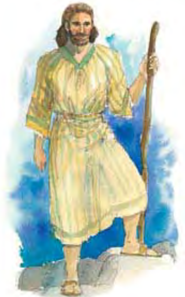
Proroci izgovaraju misli koje im Sveti Duh daje.

Odgovor: Proroci govore „naučeni od Svetoga Duha“. Oni ne izražavaju svoja vlastita mišljenja po pitanju duhovnih stvari. Njihove misli dolaze od Isusa, posredstvom Svetoga Duha.