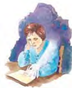
Nisu od Boga vračari i gatar koji tvrde da ih vode duhovi mrtvih.