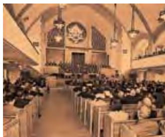
Božiji prorok će na prvom mestu da služi crkvi, a ne širokoj publici.

„A proroštvo ... je znak [služi (engleski prevod)] ... ne onima koji ne vjeruju, nego koji vjeruju.“ 1. Korinćanima 14:22.