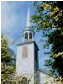
Dar proroštva je neophodan za usavršavanje Božije crkve.

„Da se sveti pripreve za djelo službe, na sazidanje tijela Hristova.“ Efescima 4: 12.