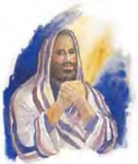
Bog obično govori proroku posredstvom vizija i snova.

„Prorok kad je među vama, ja ću mu se Gospod javljati u utvari i govoriću s njim u snu.“ „Njemu govorim iz usta k ustima.“ 4. Mojsijeva 12:6, 8.