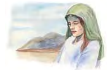
Biblija kaže da Bog daje dar

Odgovor: Ne! Pored mnogih ljudi koji su imali dar proroštva, Bog je bar još osam žena bio nadario tim darom, kao, na primer: Anu (Luka 2:36-38), Mariju (2. Mojsijeva 15:20), Devoru (Sudije 4:4), Oldu (2. Carevima 22:14), i četiri ćerke Filipa, evanđeliste (Djela Apostolska 21:8, 9).