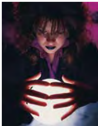
Bog ne govori Svome narodu posredstvom kristalne kugle.

Napomena: Većina od tih lažnih proroka tvrdi da održava kontakt sa duhovima mrtvih. Biblija jasno naglašava da živi nemaju nikakve veze sa mrtvima. (10. Lekcija sadrži više informacija o stanju mrtvih.) Ti takozvani duhovi mrtvih su, ustvari, zli anđeli, ili đavoli (Otkrivenje 16: 13, 14). Kristalna kugla, čitanje dlana, dešifrovanje lista, astrologija i razgovaranje sa takozvanim duhovima umrlih nisu Božiji načini komuniciranja sa ljudima. Sveto Pismo jasno uči da su odvratni svi koji se time bave (5. Mojsijeva 18:12). Čak i gore od toga, oni koji nastave da čine tako neće ući u Božije carstvo (Galatima 5:19-21; Otkrivenje 21:8; 22:14, 15).