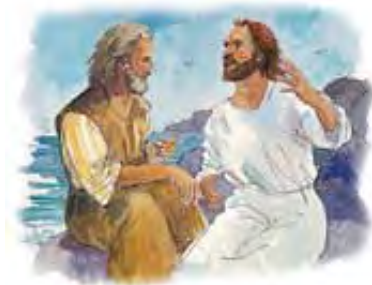
Reči istinitog proroka predstavljaju specijalnu Isusovu poruku Njegovom narodu.

Odgovor: „Svedočanstvo Isusovo“ znači da prorokove reči dolaze od Isusa. Prema tome, mi treba da smatramo reči istinitog proroka kao Isusovu specijalnu poruku za nas (Otkrivenje 1:1; Amos 3:7). Na bilo koji način zameriti istinitom proroku je vrlo opasna stvar. To je isto kao zameriti Isusu koji proroke šalje i upravlja. Onda nije ni čudo što Bog ovako upozorava: „Prorocima mojim ne činite zla.“ Psalmi 105:15.